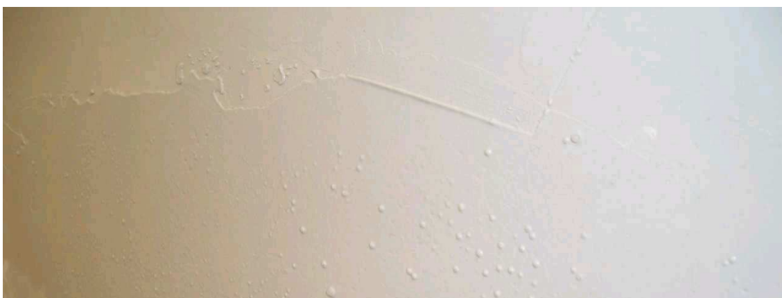
ビニールクロスへの上塗り時に出た気泡

※注： ビニールクロス下地やコンパネ下地 の場合、塗り付けた時に 気泡 が出る場合があります。気泡が出た場合は直ぐにステンレスコテを左右に動かし気泡を潰し（2～3度繰り返すと気泡は消えます。）その後、パターン付けをして下さい。